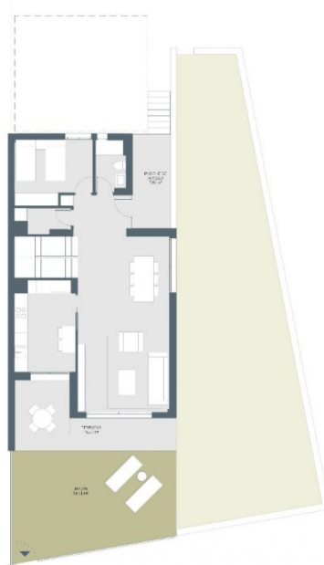
JARDÍN Y COCINA CERRADA